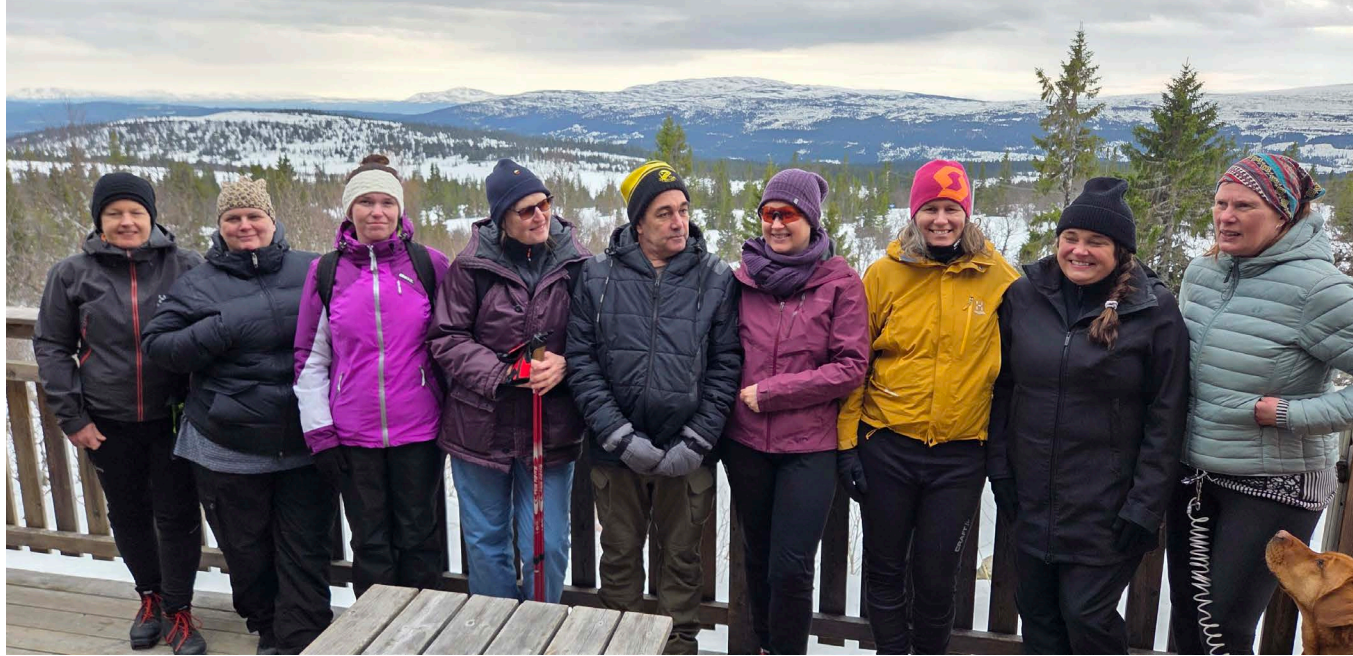
Syntolkning: Deltagarna står uppradade i vinterskrud på en terrass, med Jämtlandsfjällen i bakgrunden.