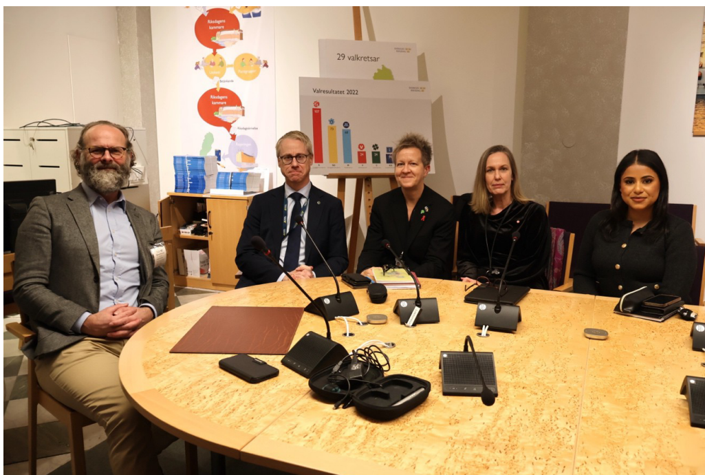
Syntolkning: Foto på Klas Nelfelt tillsammans med oppositionspartiernas representanter för funktionshinderfrågor.

I september kom regeringen med budgetförslag som innehöll små satsningar kring tolktjänst. 5 miljoner för att skapa nationell funktion, 41 miljoner extra i statsbidrag till tolkcentraler, 30 miljoner till tolk till arbetslivet. Det är tack vare hårt arbete under två års tid, tillsammans med SDR och HRF som vi tar ett kliv framåt.